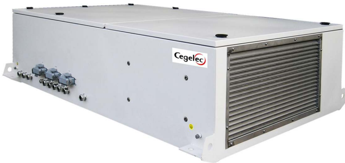
TV Europulse typ CAC 201N NF